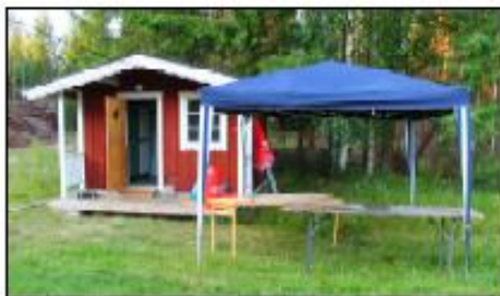
Oppetider Gottegarderober: Efter middagen