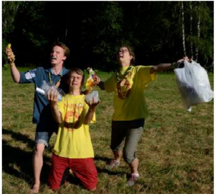
Desperata poeter, vad ska de göra med allt sitt skrap?

I stunder som dessa, Aslan sina klor måste vässa Med all sin kunskap och list, Kan han lösa denna papperskorgsbrist!